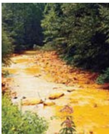
น้ำเสียขี้มีฤทธิ์เป็นกรดถูกกว้อออกมาจากเหมือง ก่อลายระบบนิเวศของสัตว์น้ำ และปนเปื้อนแหล่งน้ำชุมชน

การทำเหมืองหน้าดินรบกวนการไหลของน้ำตามธรรมชาติเป็นอย่างมาก เป็นสาเหตุทำให้น้ำท่วมมากขึ้นและยังทำให้ชุมชนใต้น้ำตกอยู่ในความเสี่ยง เมื่อเริ่มเปิดหน้าเหมือง ต้นไม้และพืชผลจะถูกกำจัดออกไปจากพื้นที่อันกว้างใหญ่ ดินจำนวนมากถูกขุดขึ้นมาและกองเป็นเนินไว้ข้างเหมือง เมื่อฝนตกกองดินหลายตันจะถูกชะล้างลงลำธาร พื้นที่ลุ่มและแม่น้ำ ตะกอนดินนี้อาจทำให้แม่น้ำตื้นเขินจนไม่สามารถใช้ทำการประมงหรือเดินทางได้